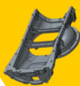
クランクケース (鋳造)